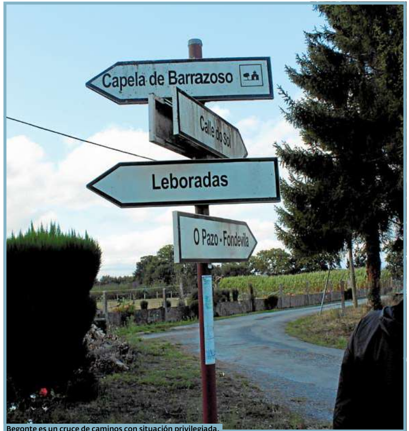
Begonte es un cruce de caminos con situación privilegiada.

El alcalde insiste en que la voluntad de la administración local es agilizar los trámites burocráticos y facilitar tanto el asentamiento de población como la puesta en marcha de empresas. Apunta que a veces la proximidad al Camino de Santiago condiciona la concesión de licencias porque dependen de la autorización de Patrimonio. «Se o Concello pode dar licenza para unha obra nun mes, Patrimonio non debería demorala con requisi-