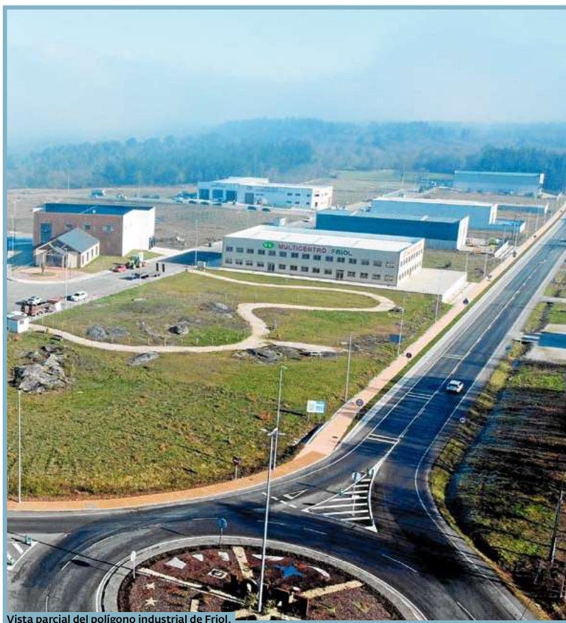
Vista parcial del polígono industrial de Friol.

Manu Soto se siente bien acogido en Friol y valora el apoyo que tuvo para prosperar. «Llegué de fuera, encontré facilidades para asentarme y desarrollar mi proyecto empresarial. Eso le puede pasar a más gente», subraya.