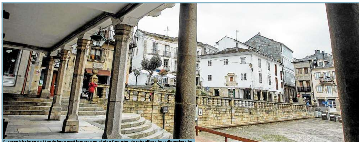
El casco histórico de Mondoñedo está inmerso en el plan Rexurbe, de rehabilitación y dinamización.